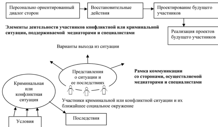
Модель восстановительной медиации