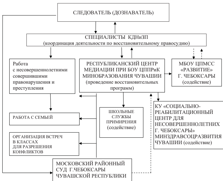
Схема алгоритма межведомственного взаимодействия по реализации восстановительного правосудия в Московском районе г. Чебоксары